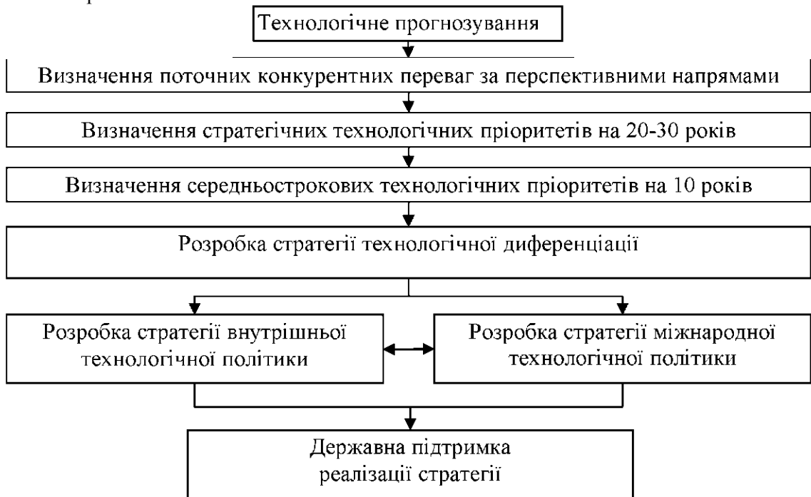
Рис. 1 – Технологічна політики з врахуванням міжнародного фактора

11111 - вищий рівень досконалості високих технологій досягається розробкою нових теоретичних положень, адекватних математичних моделей, матеріалів, технологій і технологічних режимів.