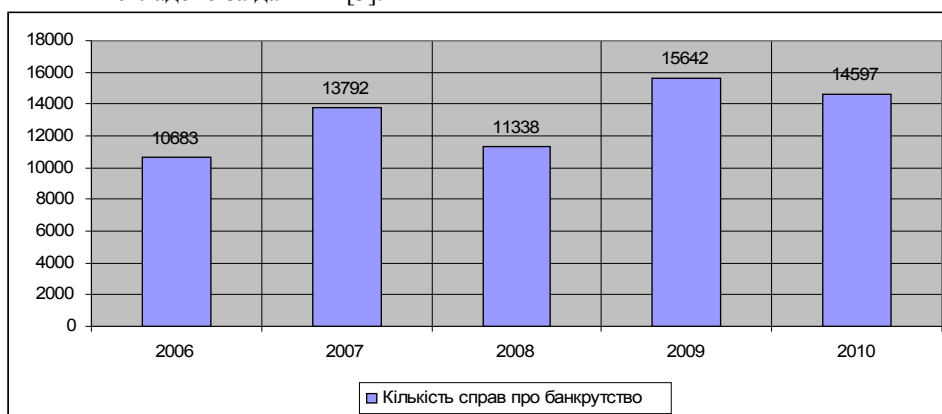
Рис. 1 - Показники порушення справ про банкрутство підприємств у 2006-2010 роках [4]

Так, 2007 і 2009 рр. характеризуються зростанням числа збанкрутілих підприємств, а 2008 і 2010 рр. відмічаються незначним їх зменшенням. Зростання числа підприємств банкрутів обумовлено, у першу